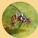
Mosca del Olivo